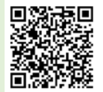
「ラーケーションの日」活動例