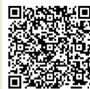
「ラーケーションの日」ポータルサイト

「ラーケーションの日」には、様々な活動ができます。どのような活動ができるのか、どうやって「ラーケーションの日」を取ればよいのかなど、興味をもった人は、保護者等に配った「保護者用リーフレット」を見たり、右の二次元コードから、「ラーケーションポータルサイト」の『ラーケーションの日』活動例を見たりしながら、保護者等と話し合ってください。